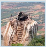
ರೆಸಾರ್ಟ್‌ಗಳಲ್ಲಿ ಪಾರ್ಟಿ ಆಯೋಜಿಸಲು ಕಡಿವಾಣ

ಬೆಂಗಳೂರು: ನಗರಕ್ಕೆ ಹೊಂದಿಕೊಂಡಿರುವ ಜಿಲ್ಲೆಗಳಲ್ಲೂ ಪ್ರವಾಸಿ ತಾಣಗಳಿಗೆ ತೆರೆತೆರೆ ನಿರ್ಬಂಧ ವಿಧಿಸಿರುವುದು ಪಾರ್ಟಿ ಪ್ರಿಯರಿಗೆ ನಿಸ್ಸಹಾಯ ಮಾಡಿದೆ. ಬೆಂಗಳೂರಿನ ನಕ್ಷತ್ರ ಪ್ರವಾಸಿ ತಾಣ ನಂದಿ ಬೆಟ್ಟದಲ್ಲಿ ಡಿ.30ರಂದು ಡಿ.1ರವರೆಗೆ ಪ್ರವಾಸಿಗರ ಪ್ರವೇಶವನ್ನು ನಿರ್ಬಂಧಿಸಲಾಗಿದೆ. ಬೆಟ್ಟದ ತಪ್ಪಲಿನ ರೆಸಾರ್ಟ್‌ಗಳಲ್ಲಿ ಪಾರ್ಟಿ ಆಯೋಜಿಸಲು ಕೂಡ ಚಿಕ್ಕುಳಾಪುರ ಜಿಲ್ಲಾಡಳಿತ ನಿರ್ಬಂಧ ಹೇರಿದೆ. ಬೆಂಗಳೂರು ಗ್ರಾಮಾಂತರ ಜಿಲ್ಲಾಡಳಿತ ಕೂಡ ಪಾರ್ಟಿ ಆಯೋಜನೆಗೆ ಅಂಕುಶ ಹಾಕಿದೆ.