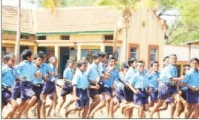
ಸಾವಿರ ರೂ.ಗಳಿಂದ 1 ಲಕ್ಷ ರೂ. ವರೆಗೆ ಏರಿತಿದೆ. ಇಷ್ಟು ಹಣವನ್ನು ಸರ್ಕಾರ ನಿರೀಕ್ಷಿಸಿ ಕಾಲ ಕೊಡಲು ಬಿಬಿಎಂಪಿ ವೇರ ಹೇಳಿದೆ. ಇದರ ಪರಿಹಾರ ಕೊಡುವಂತೆ ಸರ್ಕಾರಿ ಶಾಲೆಗಳನ್ನು ಮುಖ್ಯಮಂತ್ರಿಗಳ ಆಜ್ಞೆಯಂತೆ ನಿರೀಕ್ಷಿಸಲಾಗಿದೆ.

ನಿರ್ವಹಣೆ ಮಟ್ಟ ಎರಿ: ಪಾಲಿಕೆ ವ್ಯಾಪ್ತಿಯಲ್ಲಿರುವ ಸರ್ಕಾರಿ ಶಾಲೆಗಳಿಗೆ ವಾರ್ಷಿಕವಾಗಿ ಕೆ.ಎಂ. 12 ಸಾವಿರ ರೂ. ಮಾತ್ರ ನಿರ್ವಹಣಾ ಮೊತ್ತವು ನಿರೀಕ್ಷಿಸಲ್ಪಟ್ಟಿದೆ. ಈ ಪಾವತಿಯೇ ಮೊತ್ತವೇ ಎರಿ, ಕುಡಿಯುವ ನೀರಿನ ಎರಿ, ಶೌಚಿಗಳ ಮೊತ್ತವೇ ಮೊತ್ತವೇ 80