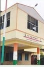
ಸರ್ಕಾರಿ ಶಾಲೆ ಉಳಿಸಿ

ನಿರ್ವಹಣೆ ಮಟ್ಟ ಛೇದನವನ್ನು ಯಾರು ಗುರುತಿಸುವರು? 100 ಮಾರ್ಚ್ 2020 ರಲ್ಲಿ 84 ಶಾಲೆಗಳಿಗೆ ವೇತನ ಪ್ರದರ್ಶನಕ್ಕೆ 400 ಸರ್ಕಾರಿ ಶಾಲೆಗಳನ್ನು, ಇದ್ದಾಗಲೇ ಎರಿಗಳ ನಗರ ಜಿಲ್ಲಾ ಶಿಕ್ಷಣ ಇಲಾಖೆಗೆ ವಹಿಸಲಾಗಿದೆ.