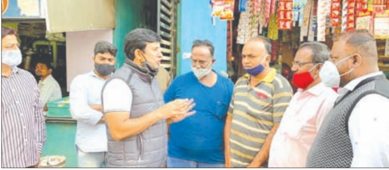
ಪಾದರಾಯನಪುರದ ನಿವಾಸಿಗಳಿಗೆ ಕೋವಿಡ್-19 ಕುರಿತಂತೆ ವಿಶೇಷ ಜಾಗೃತಿ ಅಭಿಯಾನ.