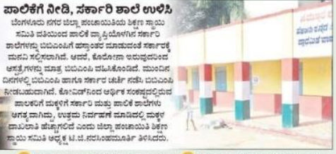
ಪಾಲಿಕೆಗೆ ನೀಡಿ, ಸರ್ಕಾರಿ ಶಾಲೆ ಉಳಿಸಿ

ಬಿಬಿಎಂಪಿ ವ್ಯಾಪ್ತಿಯಲ್ಲಿರುವ ಸರ್ಕಾರಿ ಶಾಲೆಗಳನ್ನು ಪಾಲಿಕೆಯ ನಿರ್ವಹಣೆಯಲ್ಲಿ ಕೊಂಡು ಬರುವುದು ಸರ್ಕಾರಿ ಶಾಲೆಗಳಿಗೆ ಉತ್ತಮ ವ್ಯವಸ್ಥೆ ಆಗಿದೆ. ಇದರ ಜೊತೆಗೆ ಸರ್ಕಾರಿ ಶಾಲೆಗಳಿಗೆ ಉತ್ತಮ ವ್ಯವಸ್ಥೆ ಆಗಿದೆ. ಇದರ ಜೊತೆಗೆ ಸರ್ಕಾರಿ ಶಾಲೆಗಳಿಗೆ ಉತ್ತಮ ವ್ಯವಸ್ಥೆ ಆಗಿದೆ. ಇದರ ಜೊತೆಗೆ ಸರ್ಕಾರಿ ಶಾಲೆಗಳಿಗೆ ಉತ್ತಮ ವ್ಯವಸ್ಥೆ ಆಗಿದೆ.